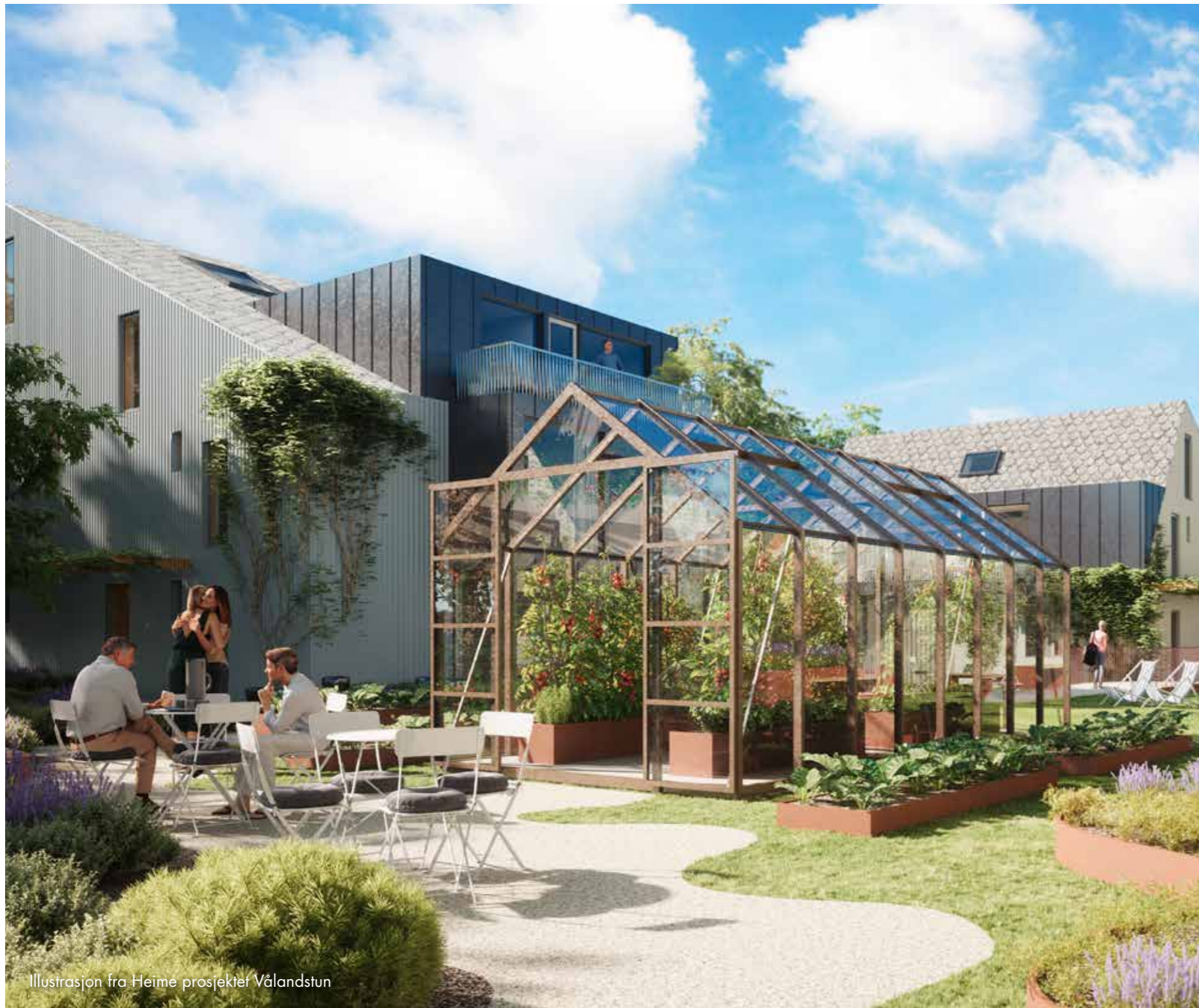
Illustrasjon fra Heime prosjektet Vålandstun