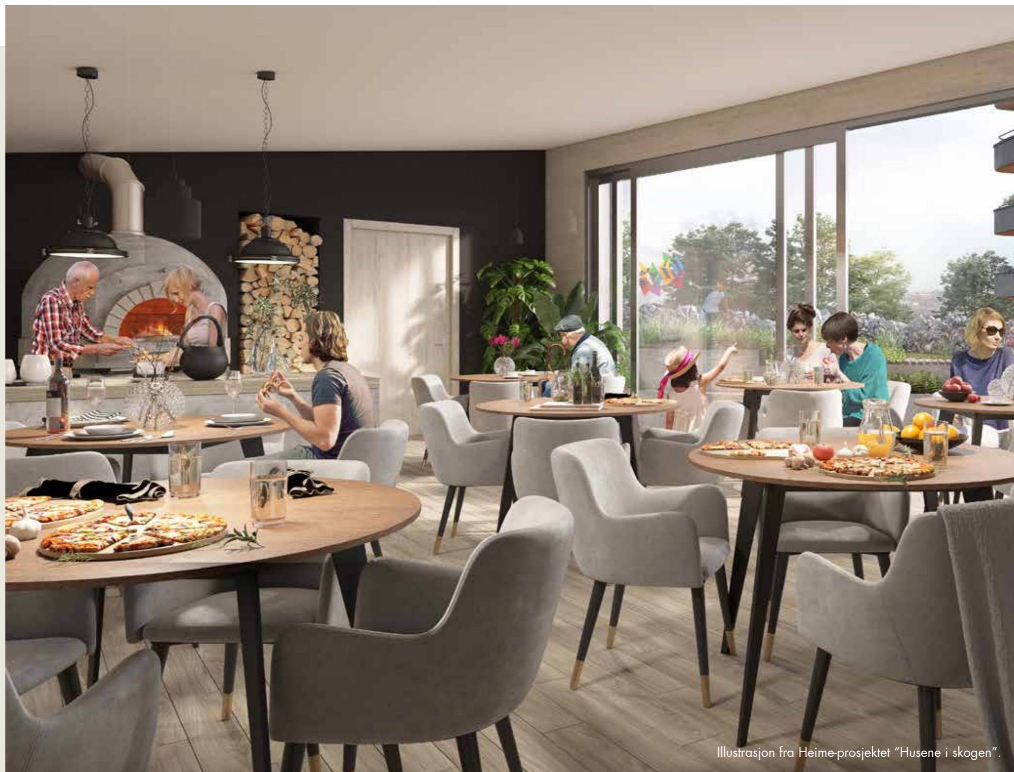
Illustrasjon fra Heime-prosjektet "Husene i skogen".

*Tjenestetilbudet vil variere fra prosjekt til prosjekt